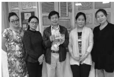
↑ 本會醫師索任分享卡介苗疫苗。