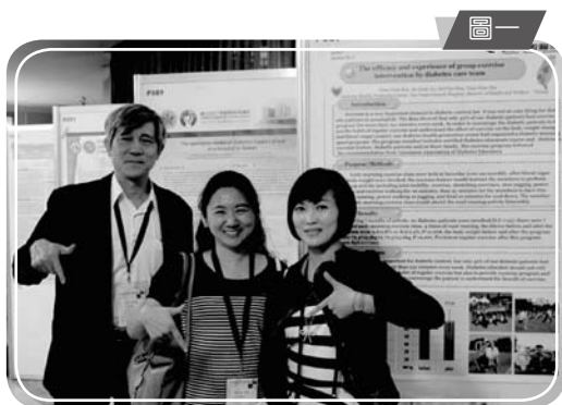
▲與成大醫院資深糖尿病衛教師並分享本院糖尿病友運動班經驗

整體而言，本次研討會有多面向的議題，包括推動綠色與健康醫院、環境健康的化學物替換、永續的醫療廢棄物管理等課程，對我們來說十分有趣也獲益良多，也發現健康促進醫院已延伸至不論是健康、環境、節能、綠化…等議題，而這些議題都是非常有意義且重要的，正如邱淑媿署長所說的「執行醫療照護的同時，也能守護地球」，積極推動健康促進同時也要努力推動綠色醫院，是此次大會所要傳達的重要理念。