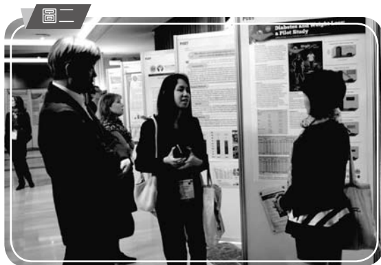
◀和馬來西亞糖尿病醫療團隊相互討論分享糖尿病友照護經驗